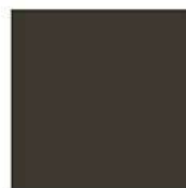
TIME 19 Museum Brown